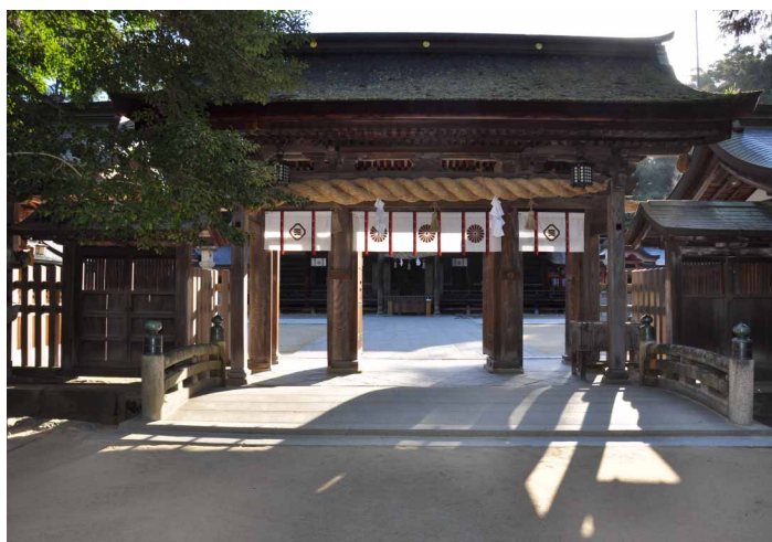
▲ 大山祇神社に参拝